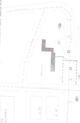
схема движения транспорта и пешеходов в окрестности МБОУ Школа №119